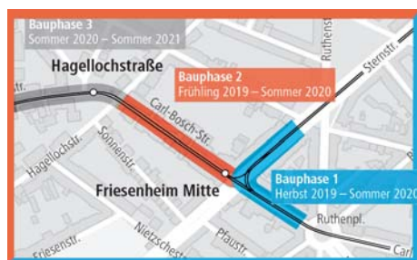
In den orange und blau markierten Bereichen wird bis Sommer 2020 gebaut. Das hat auch Auswirkungen auf den Verkehr.

Parallel zu den Gleisarbeiten saniert die rnv den rund 100 Jahre alten Abwasserkanal des WBL in der Carl-Bosch-Straße und im Kreuzungsbereich der Sternstraße. Dies geschieht in mehreren Bauabschnitten, sodass die Zufahrt für die Anlieger in Teilabschnitten möglich ist – baustellenbedingte Einschränkungen kann es dennoch geben. Da der Kanal sich in der Mitte unter der Straße befindet, kommt man an der Baugrube künftig nicht mehr vorbei.